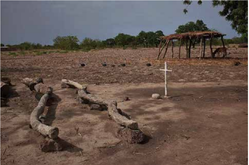
Burkina Faso Kerk in open lucht.