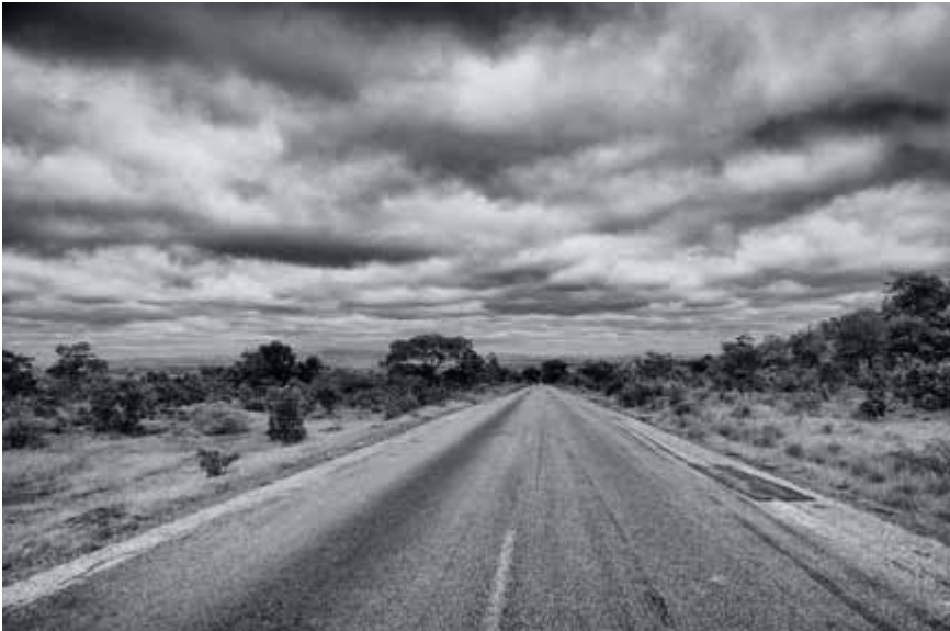
Road between Bobo Dioulasso and Banfora, Burkina Faso

Allerheiligste God uw Zoon Jezus Christus kwam onder ons om ons de weg van barmhartigheid te tonen. Help ons, door uw Geest, zijn voorbeeld na te volgen, zorg te dragen voor de noden van al uw kinderen, en zo een eensgezind christelijk getuigenis af te leggen van uw liefde en barmhartigheid. Wij bidden U in Jezus' naam. Amen.