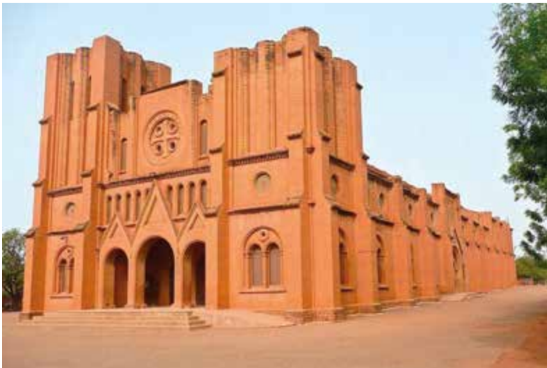
Ouagadougou - Burkina Faso De kathedraal.

Gij die leeft en Heerst in de eeuwen der eeuwen. Amen.